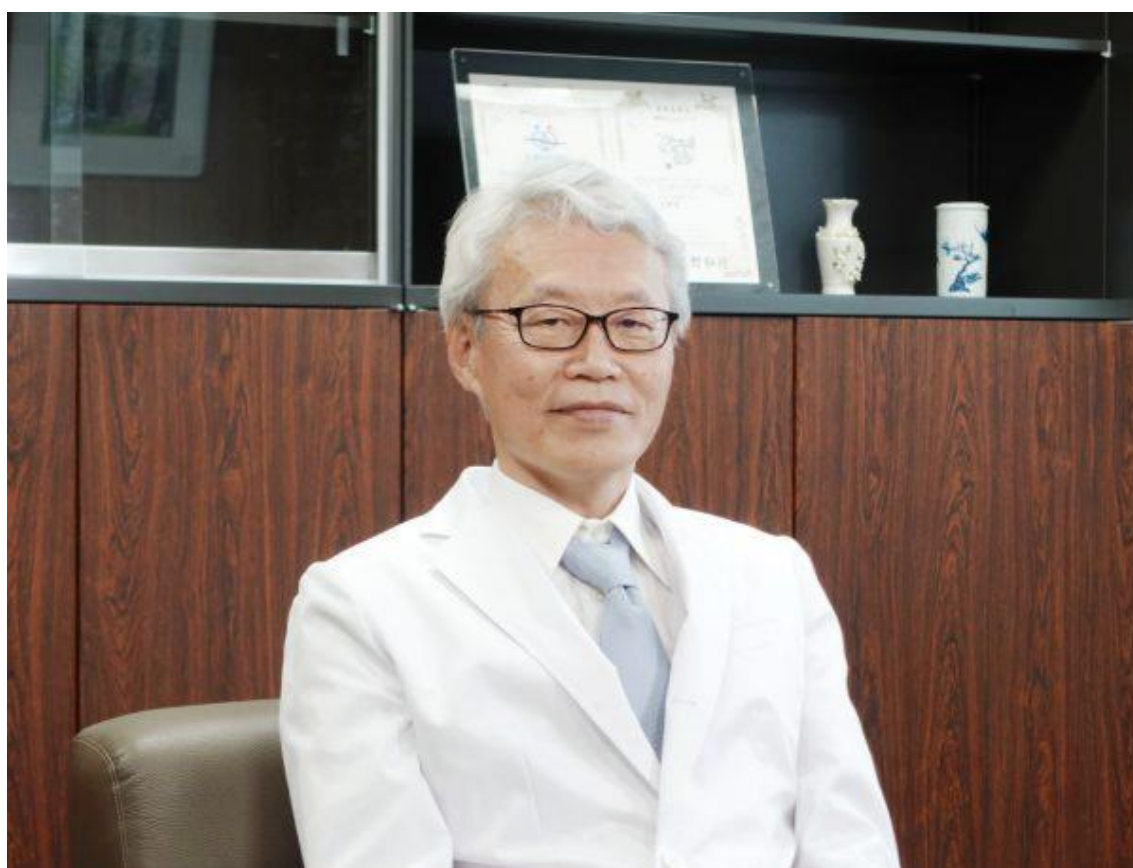
市立大津市民病院 院長